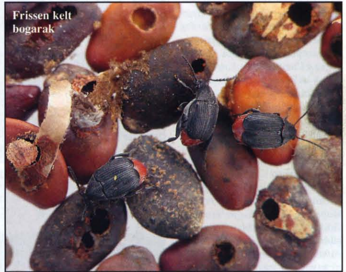
Frissen kelt bogarak