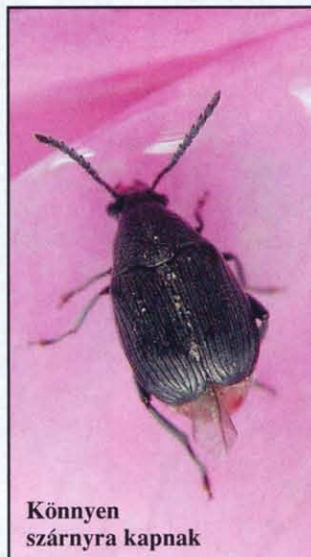
Könnyen szárnyra kapnak