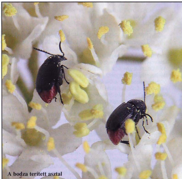
A bodza terített asztal

(Magyar Természettudományi Múzeum, Állattár)