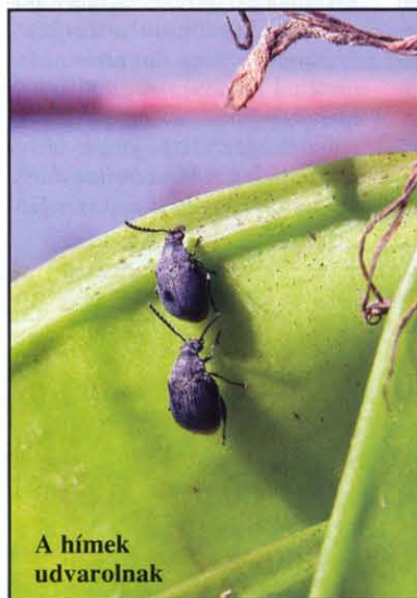
A hímek udvarolnak