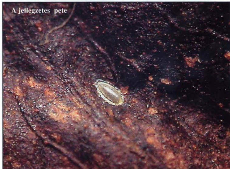
A jellegzetes pete