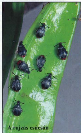
A rajzás csúcán