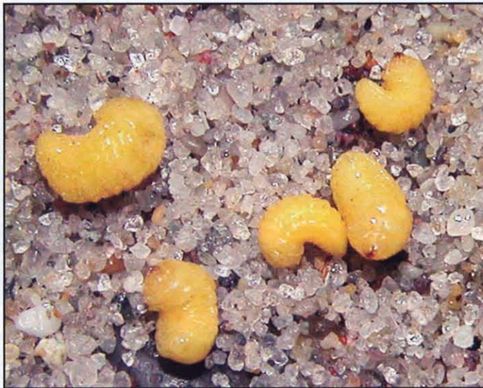
▲ Élénksárga kukacok